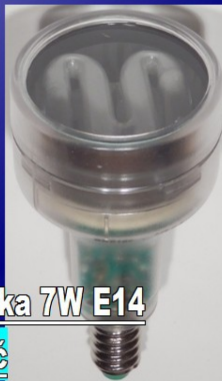
Úsporná žárovka 7W E14