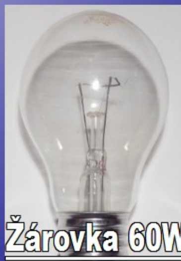
Žárovka 60W E27