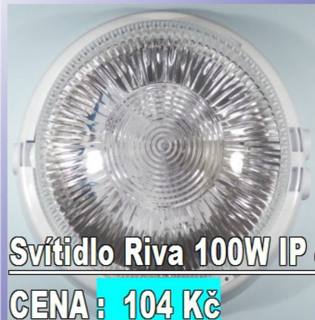
Svítlidlo Riva 100W IP 44